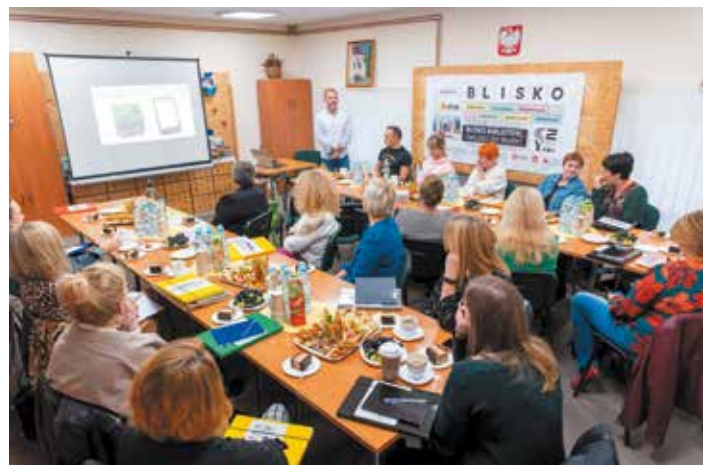
Biblioteka dla obywatela