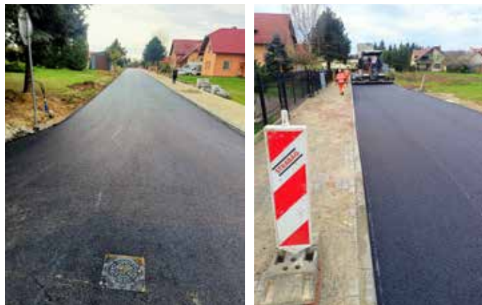
Fot. z zasobów Urzędu Miejskiego w Dynowie, droga boczna do ul. Polnej w Dynowie