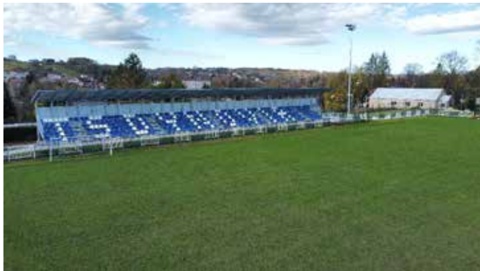
nowa trybuna dla 378 widzów