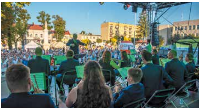
Koncert Orkiestry Dętej