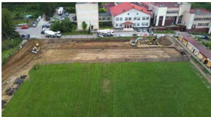
stadion miejski w trakcie przebudowy