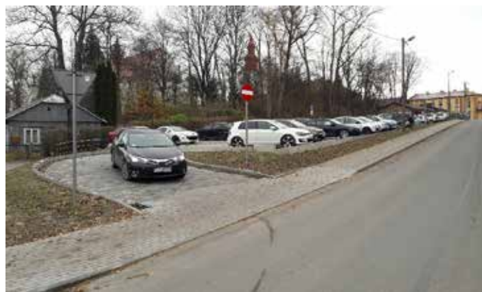
parking przy ul. Jana Pawła II w Dynowie

Wybudowany parking posiada 52 miejsca postojowe w tym cztery miejsca dla osób niepełnosprawnych. Nawierzchnia miejsc postojowych wykonana została w technologii betonowych płyt ażurowych, a drogi manewrowej, miejsc postojowych dla osób niepełnosprawnych i dojścia z parkingu do traktu pieszego tzw. „Organistówki”, z kostki betonowej. Koszt realizacji przedsięwzięcia wyniósł niecałe 500 tys. złotych. Zadanie zrealizowano ze środków pochodzących z budżetu Gminy Miejskiej Dynów.