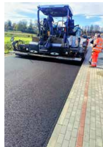
ulica Błonie w Dynowie