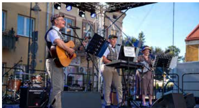
Koncert Kapeli Tonko