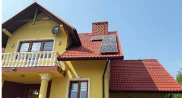
Panele fotowoltaiczne na budynku mieszkalnym