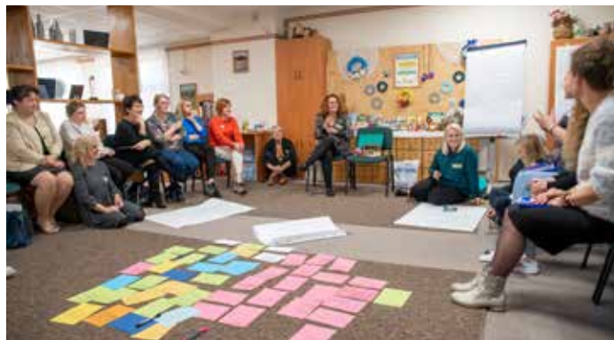
Trening kreatywności nieszlubowego myślenia