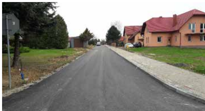
droga boczna do ul. Polnej w Dynowie