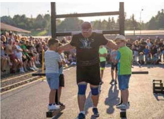
Pokazy strongman – fot. Daniel Gąsecki

OSP Wyreby, OSP Łubno, OSP Dylągowa, OSP Dąbrówka Starzeńska którzy pomagali w zabezpieczeniu oraz regulacji ruchu podczas Dni Pogorza Dynowskiego, a także Podkarpackie Centrum Ratownictwa Medycznego za zabezpieczenie medyczne poszczególnych wydarzeń.