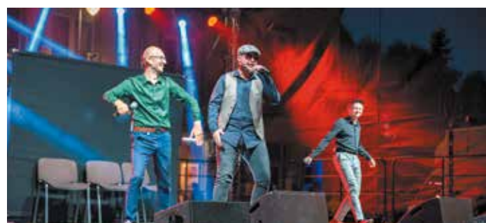
Kabaret z Konopi