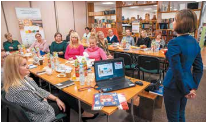
Czytanie lokatą, która procentuje