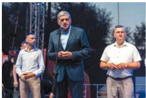
Oficjalne otwarcie 56. Dni Pogórza Dynowskiego