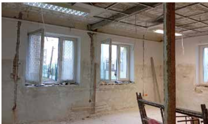
pomieszczenia budynku przy ul. Ks. J. Ożoga w Dynowie w trakcie robót