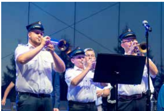
Hejnał Miasta