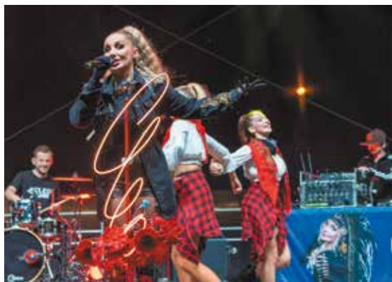
Koncert CLEO