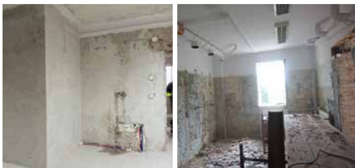
Pomieszczenia budynku przy ul. Ks. J. Ożoga w Dynowie – w trakcie robót

Wartość robót budowlanych wraz z wyposażeniem wynosi: 433 244,02 zł., w tym: dofinansowanie 178 000,00 zł., pozostała wartość 255 244,02 zł. ze środków własnych budżetu miasta.