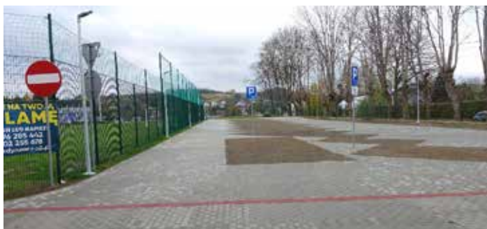
parking przy stadionie miejskim w Dynowie