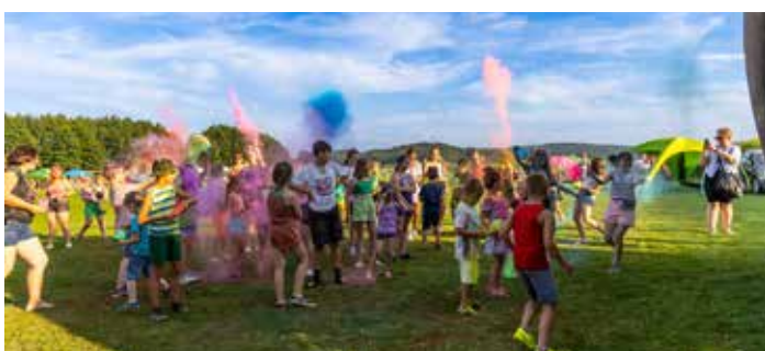
Piknik rodzinny