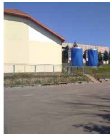
nowe zbiorniki na wodę uzdatnioną