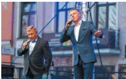
Kabaret Rak