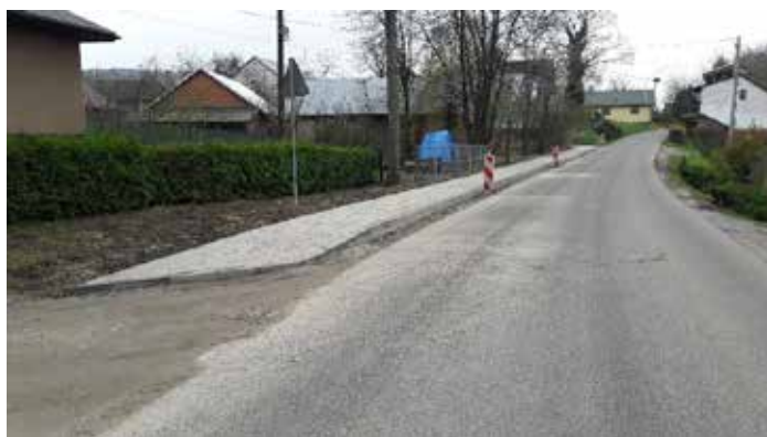
chodnik przy ul. Bartkówka w Dynowie

Przedmiotowe zadanie realizowane jest sukcesywnie przez Starostwo Powiatowe w Rzeszowie, przy wsparciu finansowym Gminy Miejskiej Dynów. W roku 2023 zrealizowano kolejny odcinek budowy chodnika dla pieszych o długości 70 mb. Koszt zadania wyniósł około 75,5 tys. złotych, Wykonawcą robót była firma: Roboty Budowlano-Drogowe „GRANIT” z siedzibą w Częstkowicach.