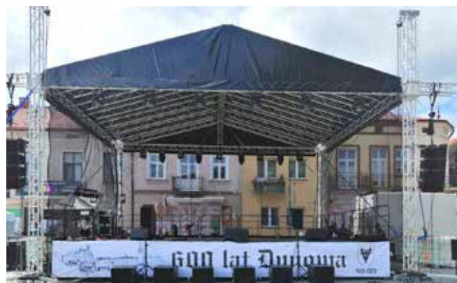
Zakupione zadaszenie sceny