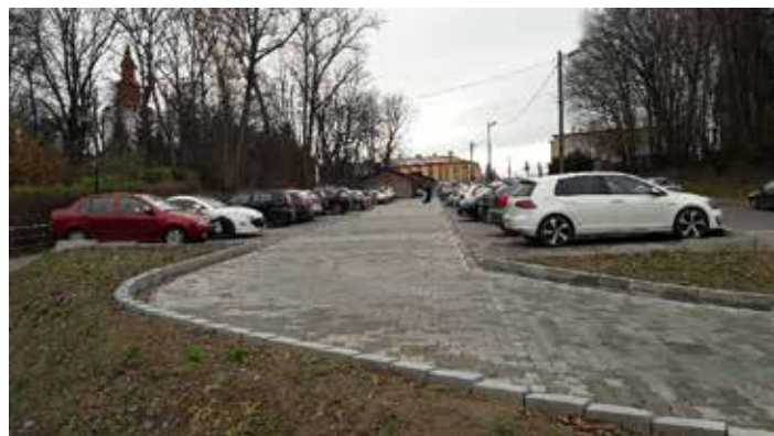
parking przy ul. Jana Pawła II w Dynowie