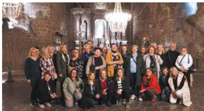
Wizyta studyjna Wieliczka