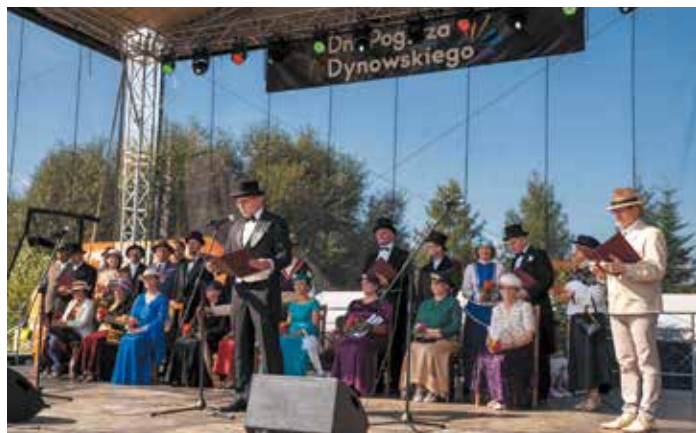
Program artystyczny w wykonaniu Towarzystwa Ginnastycznego Sokół