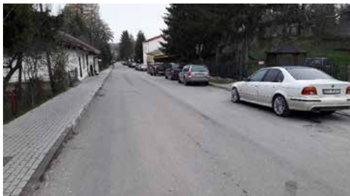
ul. Łazienna w Dynowie

Zadanie obejmowało odnowę nawierzchni asfaltowej na odcinku o długości około 180 mb., około 1 460 m 2 . Wykonawcą robót była firma Miejskie Przedsiębiorstwo Dróg i Mostów z Rzeszowa. Koszt realizacji zadania wyniósł około 190 tys. złotych.