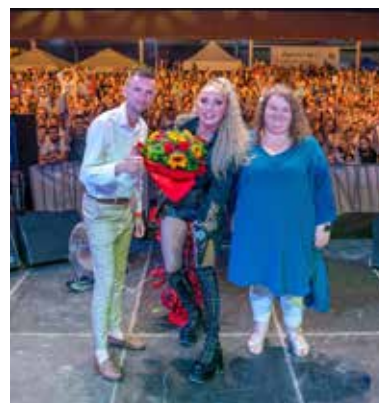
Po koncercie CLEO