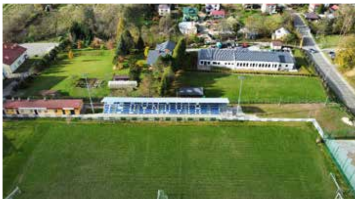
stadion miejski wraz z nową trybuną dla widzów