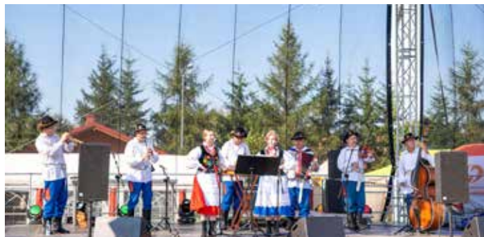
Koncert Kapeli Dynowianie