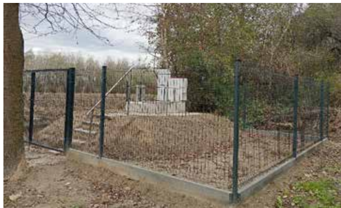
przepompownia ścieków przy ul. Bartkówka

Łączna wartość realizacji zadania: 177 670,00 zł., w całości zrealizowane ze środków własnych budżetu miasta.