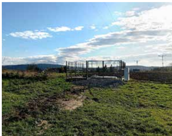
Hydrofornia podziemna przy ul. Grunwaldzkiej w Dynowie