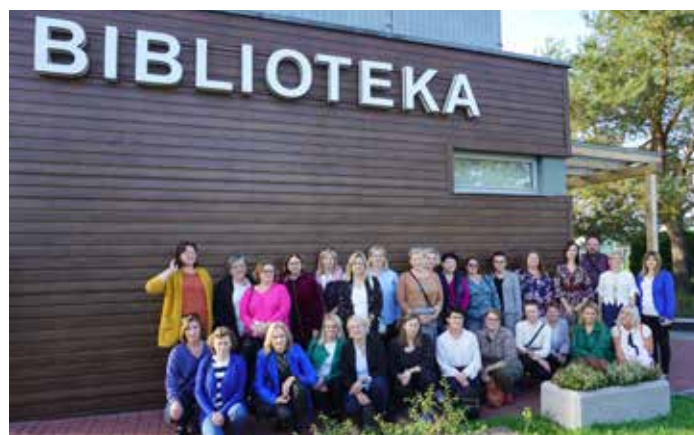
Wizyta studyjna Bojszowy