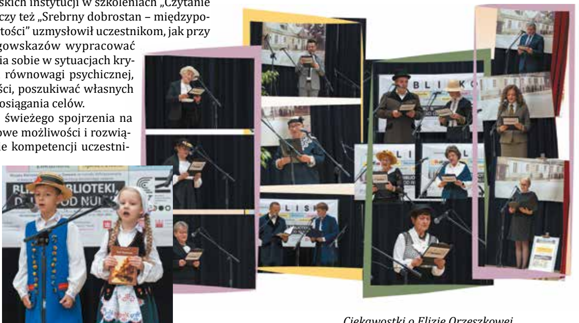
Ciekawostki o Elizie Orzeszkowej