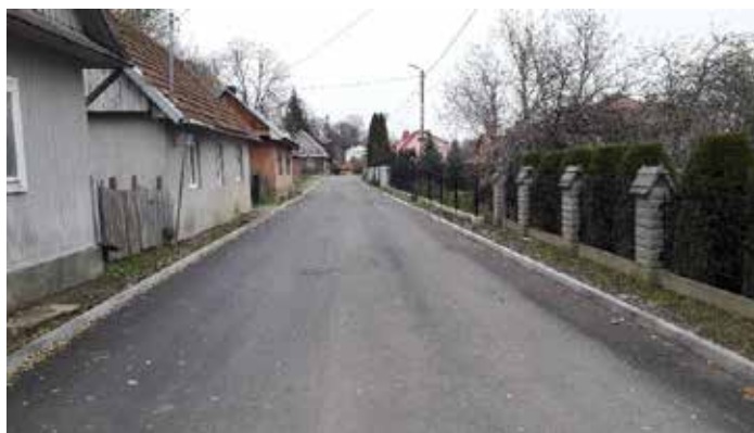
ul. Podwale w Dynowie

Zadanie obejmowało odnowę nawierzchni asfaltowej wraz z remontem krawężników betonowych na odcinku o długości około 160 mb. Wykonawcą robót była firma Miejskie Przedsiębiorstwo Dróg i Mostów z Rzeszowa. Koszt realizacji zadania wyniósł około 140 tys. złotych.