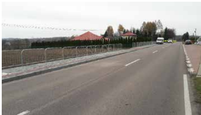
chodnik przy ul. Węgierskiej w Dynowie