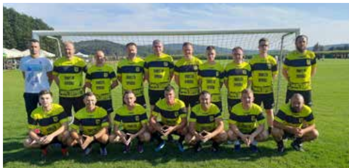
Drużyna Miasta Dynów