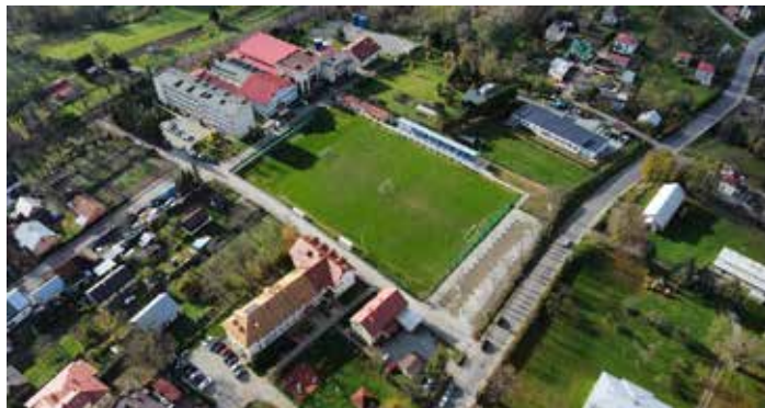
stadion miejski po przebudowie wraz parkingiem

Razem wartość robót budowlanych wraz z nadzorem inwestorskim i dokumentacją projektową: 4 212 244,39 zł., w tym uzyskane dofinansowanie w wysokości 2 891 000,00 zł., z Rządowego Funduszu Polski Ład Program Inwestycji Strategicznych – PGR, poniesione przez Gminę środki własne na realizację inwestycji to 1 321 244,39 zł.