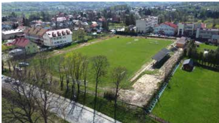
stadion miejski przed wykonaniem robót