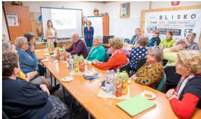
Srebrny dobrostan – międzypokoleniowa transmisja wartości