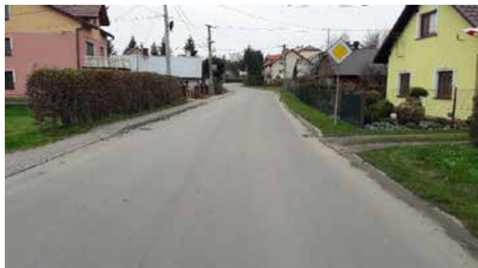
Ul. Sikorskiego w Dynowie

Zadanie obejmowało odnowę nawierzchni asfaltowej na odcinku o długości około 480 mb., około 3 000 m 2 . Wykonawcą robót była firma Miejskie Przedsiębiorstwo Dróg i Mostów z Rzeszowa. Koszt realizacji zadania wyniósł około 312,5 tys. złotych.